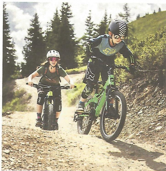
Die einfache Streckenführung macht die Flowline zum absoluten Family Trail