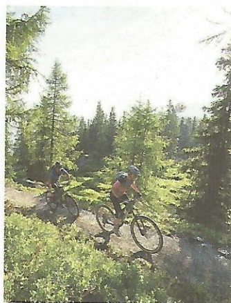
Bergauf geht es für Zweiradliebhaber am Uphill Flow Trail

Im Bikepark Schladming können 35 Kilometer Trails entdeckt werden. Mit der Planai 10er Hauptseilbahn gelangen Biker und ihre Sportgeräte rasch und bequem auf den Berg. Die acht Kilometer lange Flowline ist ideal für Familien mit Kindern geeignet. Der Uphill Flow Trail sorgt für ordentlichen Spaß bergauf. Die Strecke lässt sich sowohl mit dem E-Mountainbike als auch mit einem traditionellen Mountainbike angenehm bewältigen. Und in der Bike Area unterhalb der Planai Bergstation finden all jene, die noch nie in einem Bikepark waren, das richtige Gelände.