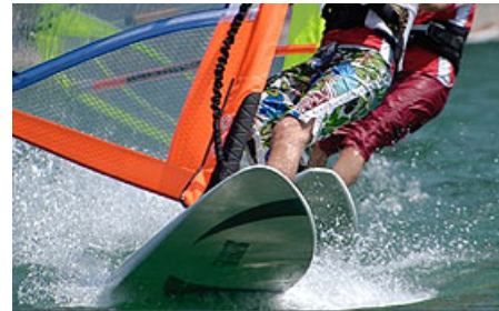
Casa Crone - Idrosee

Mountainbiken in den umgebenden Bergen - und das sind nur einige der zahlreichen möglichen Aktivitäten vor Ort. Dazu kommt unser anspruchsvolles Programmangebot „Jugend Plus“ das Sport, Spaß und Entdeckungen für Ihre „Großen“ bietet. Doch auch ohne dieses Angebot kann man hier als Familie einen tollen individuellen Urlaub abseits der üblichen Touristenpfade erleben.