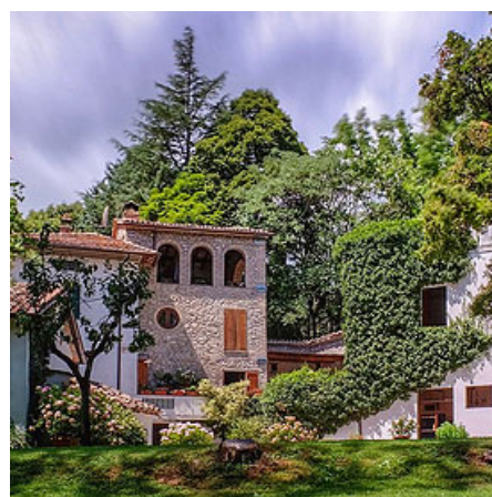
Il Mulino - Umbrien